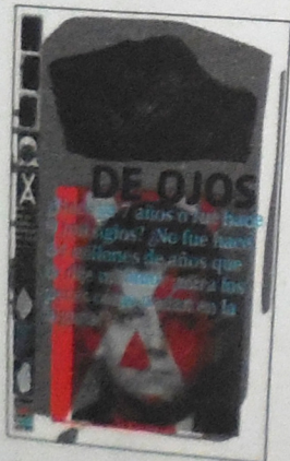
En un abrir y cerrar de ojos.