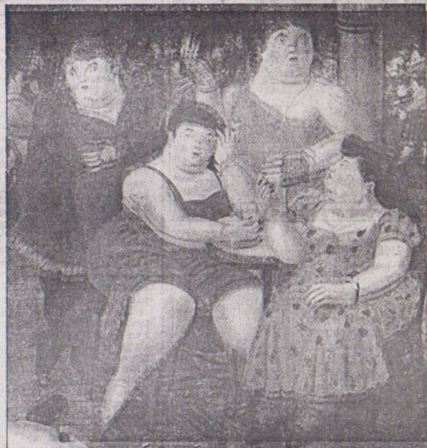
"Cuatro mujeres" de Fernando Botero, muy bien representado en esta exposición