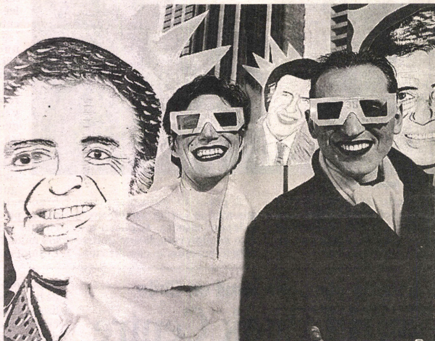
Marcos López: "Buenos Aires, la ciudad de la alegría". Foto sobre tela de 400 por 300 cms. Original en color.

tintas o pigmentos, se rehabilitan procesos antiguos como el calotipo o el daguerrotipo".