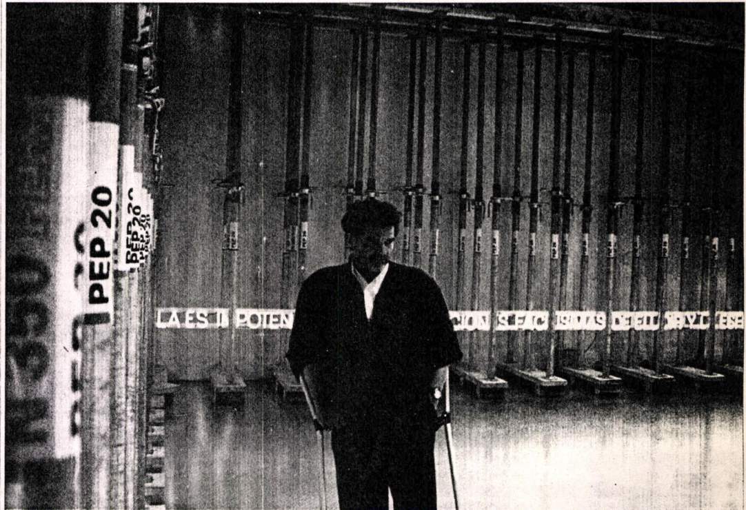
El artista y su texto electrificado.

Si se concede que tales procedimientos se ubican en un marco conceptual demasiado complejo, resulta explicable que el artista se muestre algo escéptico frente a la comprensión de que pueda gozar su obra entre el público, dilema que para él es mayúsculo, y que no parece haber resuelto tras casi tres décadas de sortear la tentación del lugar común.