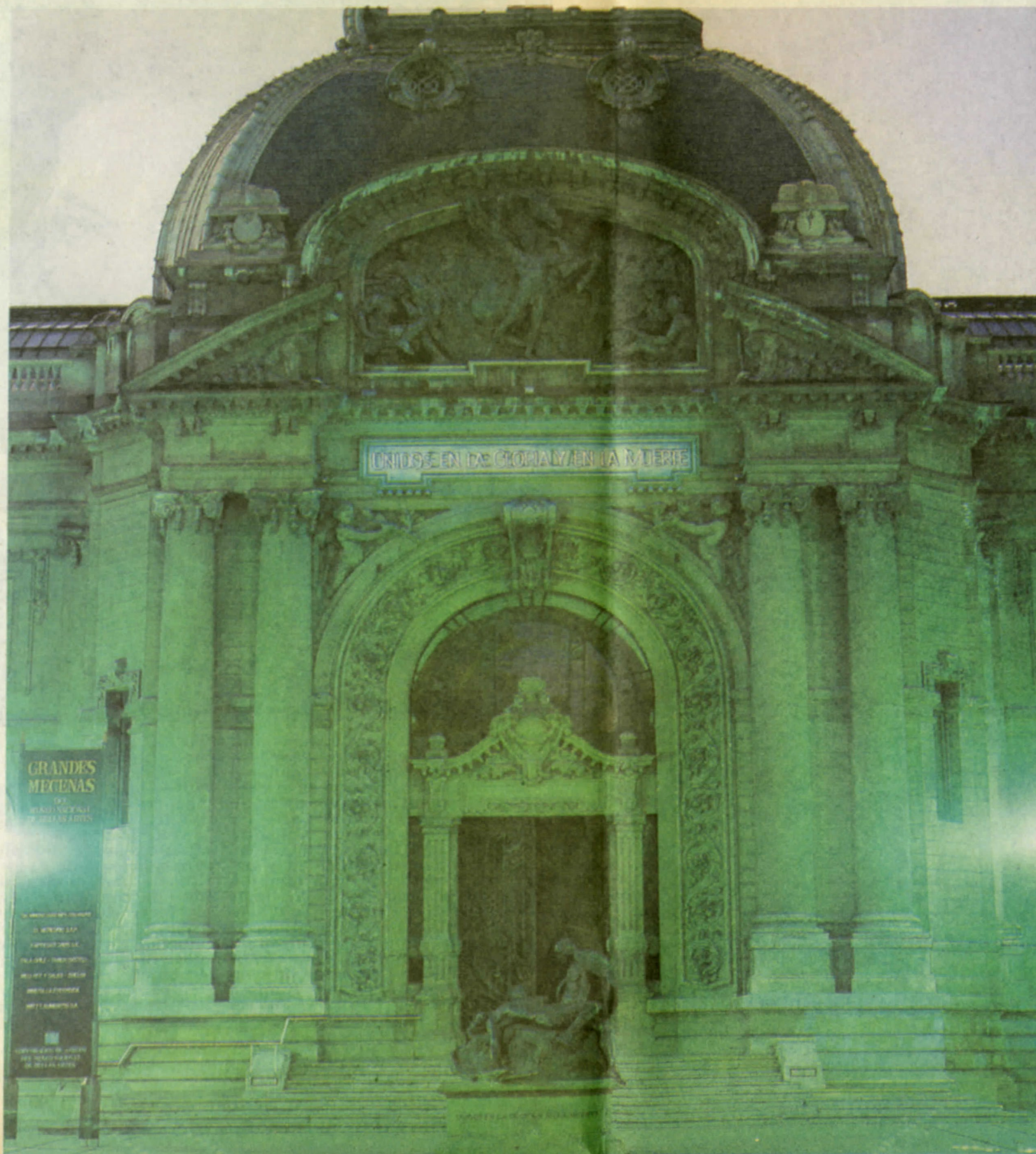
Intervención en la puerta del Museo Nacional de Bellas Artes.

La instalación de Gonzalo Díaz, por su carácter imponente —'monumental', como se autocalifica— y por 'intervenir' el edificio del museo desde la fachada misma, puede ser la ocasión para ampliar la recepción pública de un arte que en otras latitudes es ya un dato conocido. De ello dio testimonio en este mismo diario, hace poco, la información sobre la exposición británica Sensation , recientemente presentada en la Royal Academy of Arts de Londres. (Esto último no deja de tener su ironía, y tal vez su paralelo: también el Museo Nacional de Bellas Artes es, si se quiere, nuestra consagración, nuestra Academia... Y hoy por hoy las 'transgresiones' están instalándose allí).