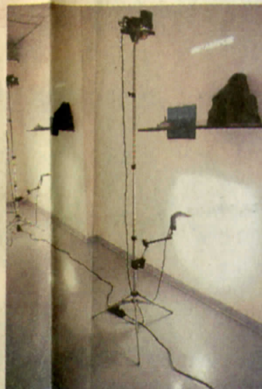
Quadrivium/Ad usum Delphini, instalación. Detalle VII estación HIPERBATON.

oportunismo. Si entiendo bien este reparo, lo que en él está en liza es que la obra que obedece a la ley de lo site specific se diseña en atención a las peculiaridades —físicas y semánticas— del sitio de su emplazamiento, dispersando la unidad de la intención artística en conformidad con esas peculiaridades, mientras que la obra in situ —en la comprensión que Díaz tiene de ella— es producida a partir de una interrogación general del espacio de arte, la cual retiene la unidad de intención en un diálogo reticente con la especificidad lugareña. Así, en la obra in situ , la escena se despliega en un espacio estrictamente virtual , que no es otro que aquel espacio definido por lo que antes he llamado el "efecto de conjunto" de la instalación y que también podría denominarse su efecto de sentido. Por otra parte, el estilo de oblicuidad con que son manipulados los varios códigos concitados en ese espacio virtual, condiciona y reclama, de parte del espectador, una lectura de reojo , nunca frontal. Esta lectura confirma, a su vez, la necesidad de la presentación serial. Por último, cada uno de esos códigos funge a manera de escala, y la heterogeneidad de estas escalas, con las cuales se construye la instalación, es suficiente para producir una suerte de neutralización semántica: el espectador queda librado a la orfandad interpretativa. Se le enfrenta, sin más trámite, con aquello que Díaz se place en denominar operaciones visuales .