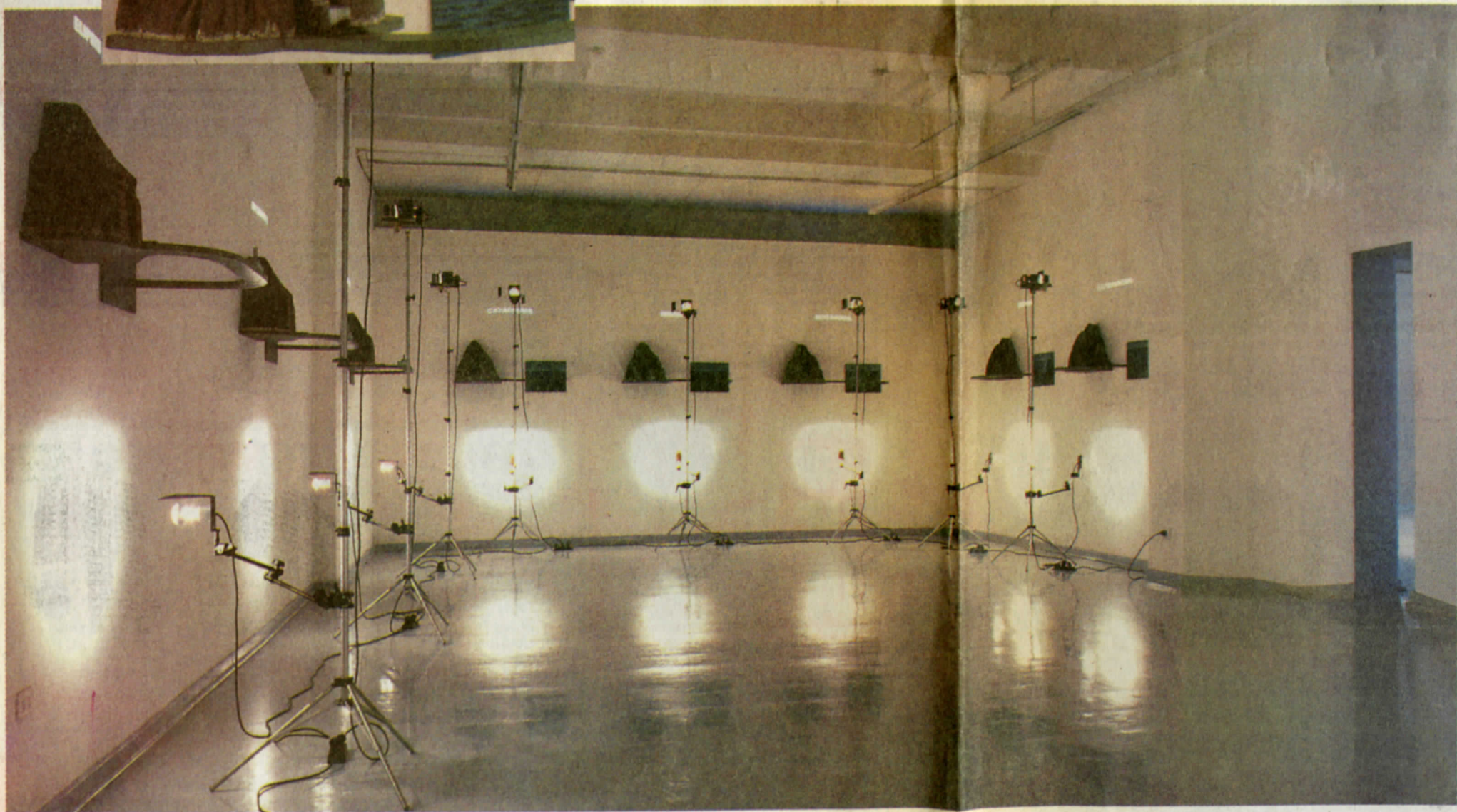
Quadrivium/Ad usum Delphini, instalación. Vista general.