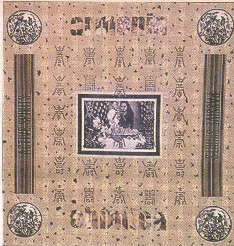
Arturo Duclos podría enviar cuatro lienzos a Lisboa. En ellos ha experimentado la técnica de la transferencia textil. Uno de ellos es "Armonía química".

romántico alemán Novalis: "Buscamos por doquier lo incondicionado y encontramos siempre sólo cosas". El original estará en alemán y sus letras tendrán un tamaño de 15 centímetros (cuatro metros en total), las cuales serán