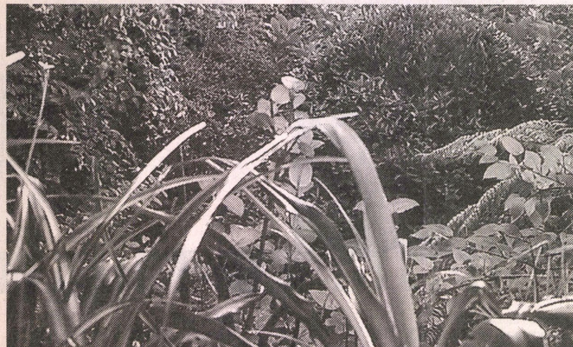
Una de las imágenes que integran la muestra fotográfica "Desde el Jardín" de Eduardo Vilches.