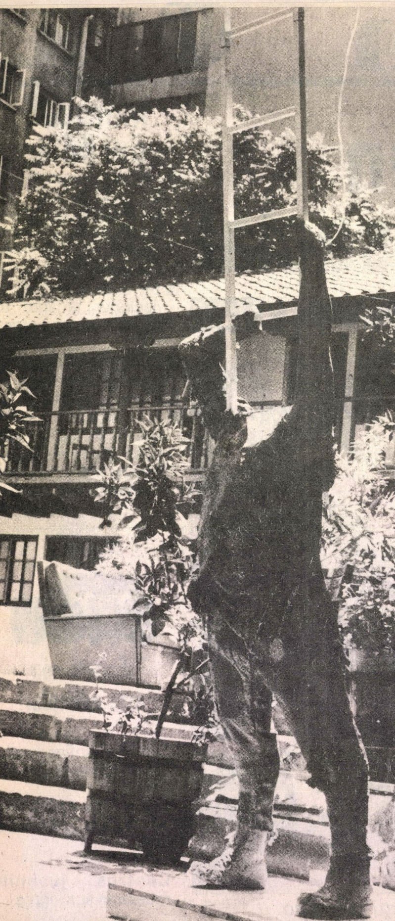
Hugo León: el primer premio del certamen le permite, además de un incentivo material, colocarse en el primer plano de la escultura nacional