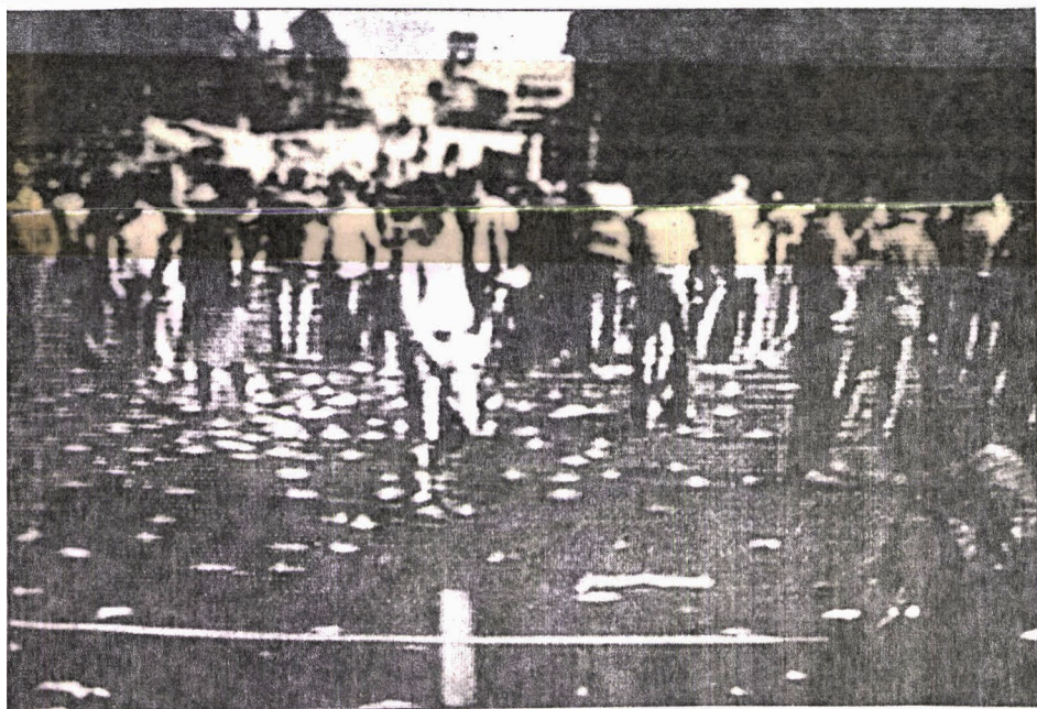
"Lotty Rosenfeld. Edificio Diego Portales, Santiago, 1988, instantánea del video de una acción de arte. ".

La exposición se realizó con la asistencia de la Oficina del Rector de Rutgers, la Universidad del Estado de Nueva Jersey, la Misión Permanente ante Naciones Unidas, el Ministerio de Relaciones Exteriores de Chile, la División de Cultura del Ministerio de Educación de Chile, y el Jane Vorhees Zimmerli Art Museum, Rutgers, la Universidad del Estado de Nueva Jersey".