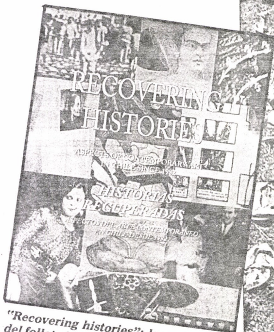
"Recovering histories": la portada del folleto bilingüe.

Y luego: "En los inicios de los noventa, Chile retorna a la democracia con las características propias de la transición y el lastre inevitable de diecisiete años de dictadura".