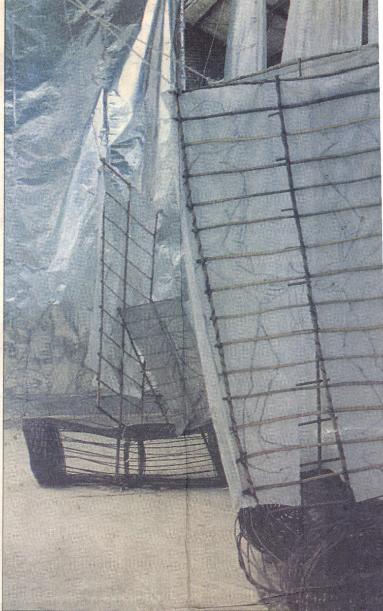
De Nancy Gëwöld, "Y los onas no navegaron nunca", detalle de la instalación en la Bienal Internacional de Arte de Valparaíso, 1987.

El crítico y profesor de arte Gaspar Galaz, en un tercer ensayo, hace un bosquejo del arte chi-