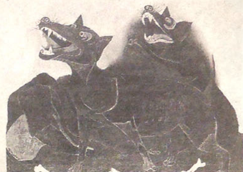
La muestra incluye un buen número de obras de Tamayo Rufino. En la foto, "Animales" de 1941.