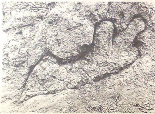
Ana Mendieta utilizó la fotografía para esta obra, sin título, de 1980.