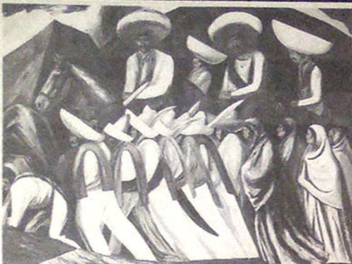
"Zapatistas" de José Clemente Orozco es uno de los óleos más representativos del arte latinoamericano de la década del 30.