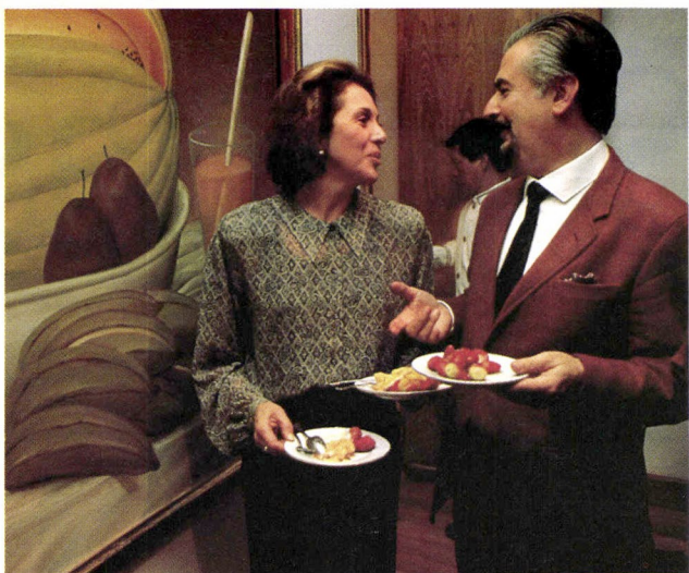
▲ Fernando Botero, su esposa y Jackie Kennedy asistieron a la inauguración de la muestra pictórica.