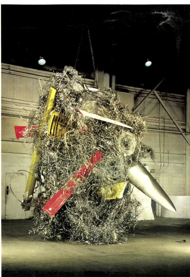
▲ En su exuberante escultura "Unclassified", de 1992, la brasileña Frida Baranek insertó trozos de fibra de vidrio del Departamento de Defensa de los Estados Unidos, en un remolino de alambres de acero inoxidable y de aluminio.

Para los neoyorquinos, que ya se han familiarizado con el arte latinoamericano a través de las exitosas y publicitadas subastas de Christie's y Sotheby's y de la magnífica muestra de "México: Treinta Siglos de Esplendor" -montada por el Museo Metropolitano en 1990-, la exhibición del MOMA representa una buena oportunidad para examinar los distintos movimientos y tendencias que han caracterizado la creación artística de nuestro continente durante los últimos ochenta años. La recopilación, que incluye cerca de 300 obras de más de noventa artistas, está dispuesta cronoló-