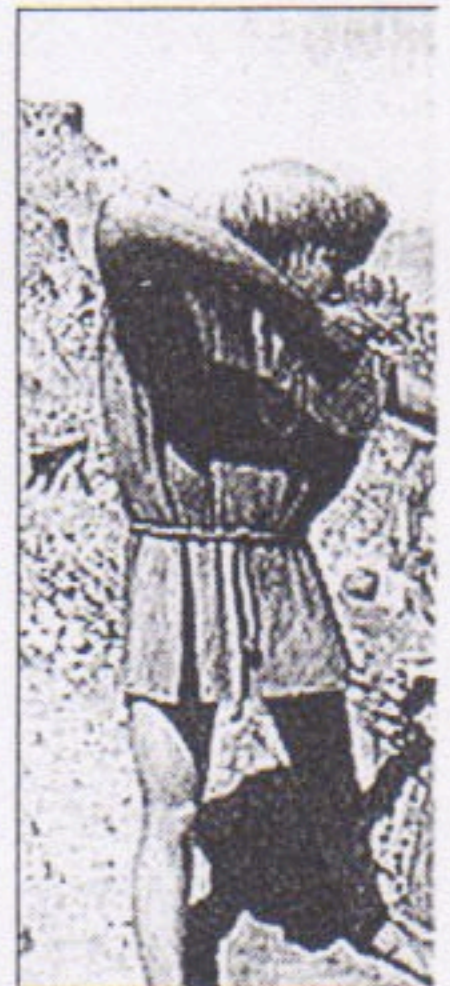
PUKARÁ DE QUITOR.— D

Del extremo austral nos varias referencias a los nativos de Tierra del Fuego que fueron exterminados con la colonización iniciada en el siglo XIX. O en los dibujos cómo estos recolectores andaban desnudos provistos de un arco, a pesar del frío invierno. Aunque fue una soc-