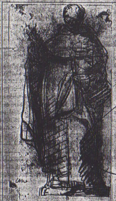
Uno de los dibujos de Alonso Cano.

Se presenta en el Museo del Prado una exposición singular, compuesta por trece cuadros que Francisco de Zurbarán pintó hacia 1640. Es la serie conocida como Jacob y sus doce hijos que desde el siglo XVIII se guarda cuidadosamente en el Reino Unido, doce en el castillo de Auckland, sede del obispado de Durham, y la decimotercera en la colección privada del castillo de Grimsthorpe. Es la primera vez que se exponen en nuestro país.