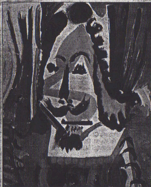
A la derecha, Busto de caballero, de Pablo Picasso.

una selección de los dibujos españoles que guardan sus fondos. Están fechados desde el siglo XV al XVIII. Entre ellos destacan los firmados por Juan Guas, Gaspar Becerra, Juan de Juanes, Ribera, Alonso Cano, Carreño, Claudio Coello, Murillo, Bayeu y Paret.