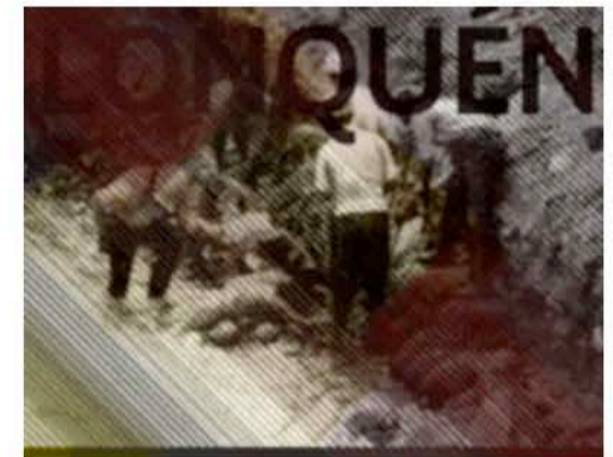
Este martes 26 de junio, a las 19:30 horas, se inaugura "Lonquén" en la Sala de Exposiciones Temporales del Museo de la Memoria y los Derechos Humanos.