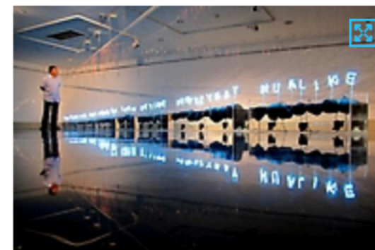
Hasta octubre estará disponible la instalación Ngen-Füta-Winkul en el Museo de Arte de Suzhou en China.

Gonzalo Díaz estudió Bellas Artes en la Universidad de Chile y se licenció en 1975. Ha expuesto su obra en forma individual en museos y galerías de Santiago y Regiones del país. Entre sus principales reconocimientos se encuentra el Premio Nacional de Artes Plásticas 2003.