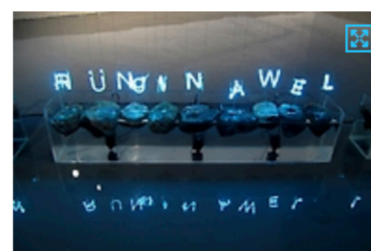
El neón es parte de la obra artística que además de la luminosidad de las palabras en mapudungun goza de una movilidad constante a partir del movimiento de las bombas de agua.