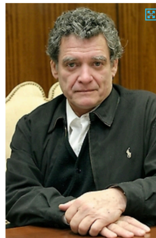
Si bien el asunto mapuche es particular, el tema de los pueblos originarios, de la diversidad, de la pertenencia a un territorio son asuntos universales, explicó el profesor Díaz.