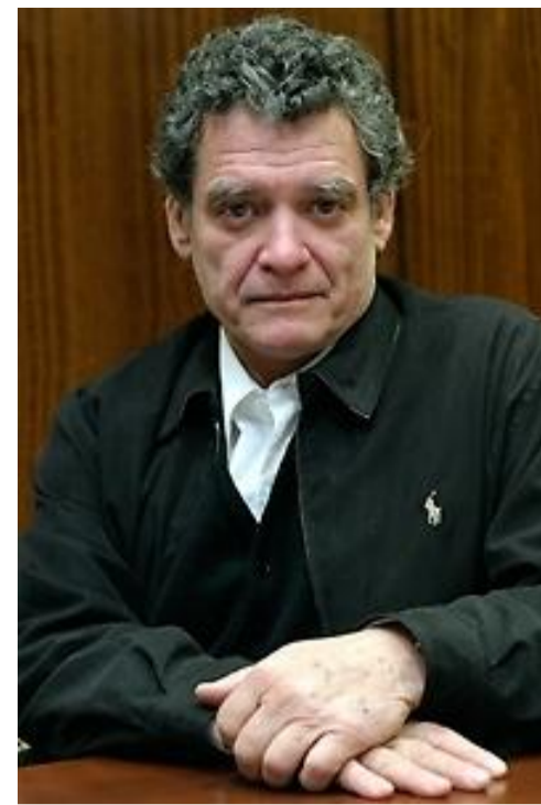
Las obras, indicó el artista y académico, son "reflexiones sobre el lenguaje".

Así, “El Mito de la Caverna”, “El Soberano”, “Realismo Socialista”, “El Fin de la Historia”, “La Novia Muerta. En el Centenario de la Revolución Bolchevique”, “El Último Cuadro de Malevich”, “Madre, esto no es el Paraíso”, “La República” y “Civitas Dei” , creada en conjunto a Carlos Vidal –títulos de las obras que componen “Notizen”- utilizan materialidades que van desde instrumentos de medición, pasando por metales fundidos, luces de neón, hasta piezas mecánicas y sistemas electrónicos.