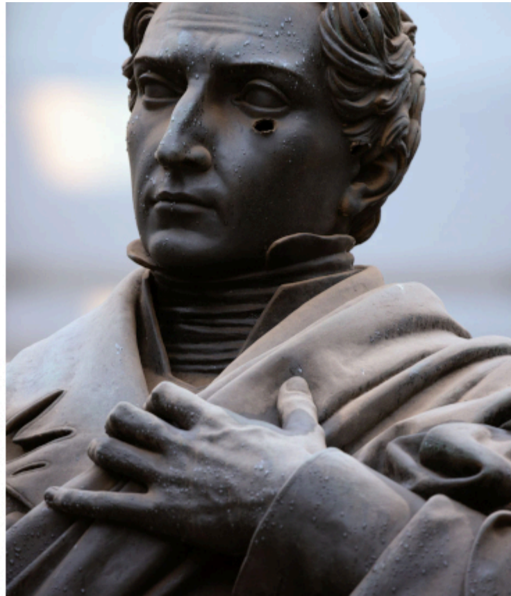
Monumento a Diego Portales, en la Plaza de la Constitución.