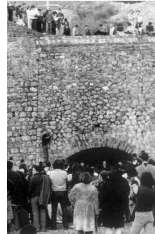
Peregrinación a Lonquén, Luis Navarro , AFI .