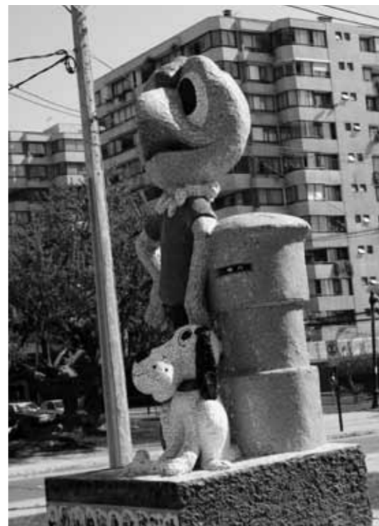
Condorito. [Sammy Salvo, escultor.] Gran Avenida, Parque del Comic, I. Municipalidad de San Miguel, Santiago.

MOVIMIENTOS SOCIALES. Una ética perteneciente al ser social. "No se detienen los procesos sociales, ni con el crimen, ni con la fuerza. La historia es nuestra y la hacen los pueblos." Fragmento último discurso de Salvador Allende, 1973. La desesperanza se ha transformado en el signo de los tiempos. El orden establecido es lo suficientemente violento como para aquietar la acción; el devenir. Millones de ciudadanos que, en una imagen nostálgica, caminaban por las calles, la voz de un pueblo sobre alamedas, que hoy se ha trasladado al automatismo de la vereda de cemento. Una duda irreverente que pone inestabilidad sobre el sentido, sobre el cómo y el para qué . Los movimientos sociales surgen de los movimientos individuales, una revolución que permita abrir el diálogo, provocar al movimiento. Seducir al roce discursivo, seducir al choque de argumentos, seducir al dolor del pasado, seducir los deseos del presente, seducir a otro a pensar sobre el seducir a otros. Quizá, las calles quedarán en una imagen petrificada como el lugar de habla de un pueblo, de un país; pero los movimientos, los procesos sociales, no se detienen. Las utopías no divagan sobre lo irreal, sino sobre la necesidad. La materia no desaparece, se transforma... el hombre y la mujer, deben ser y hacer historia. Héctor Freire, director y actor de teatro.