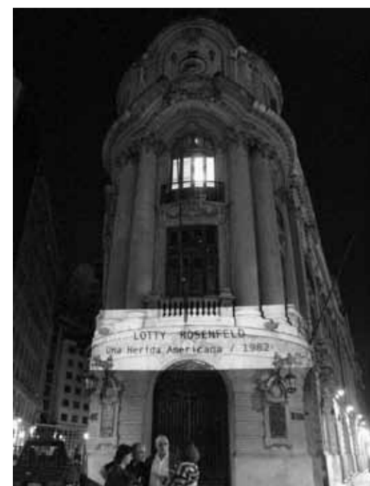
Estadio Chile I, intervención de la fachada del edificio de la Bolsa de Comercio de Santiago, octubre 2009, Trienal de Chile. Lotty Rosenfeld, artista visual.

BORDES. Partiré de un borde , ahí donde fracasa el significante, donde la india y el indio se hacen pliegue puestos a coger el goce. El punto de partida es otro borde ahora, es la orilla fracturada que bordea bordando hacia atrás y hacia adelante, por las comisuras de bocas tapadas, lenguas arrancadas y niños muertos que van circundando con sangre las siluetas sin caras (quiero decir descaradas), que los fusilan por la ordenanza oficial que se cree blanca y razonable en un país colmado de indios, indias, mestizos y otros entre-bordes . Si voy, profundo por los dos bordes desbordados con el labio redondeado , esta vez a fuerza de tanto espanto. El indio y la india, ahora, apoyan el pie restante en la otra orilla , el único borde que quedaba, y una grieta de horror y de muerte late debajo y también encima, el borde ahora, no espejea, no devuelve la bordadura a la india y al indio. Las siluetas descaradas se repiten como disco estropeado y siguen armados y acobardados al centro de la trinchera (le temen al borde y al des-borde ), disparan a un rostro que reposa en otros cantos , a la orilla de otro tiempo, y aparecen los filos del cuerpo restante y mutilado del indio y de la india... el indio y la india siempre vuelven a hablar por los costados que explotan a través de la huella dejada por la lápida, por el resabio de todos los bordes que se levantan y por las des-bordadas costuras del fracaso del significante.