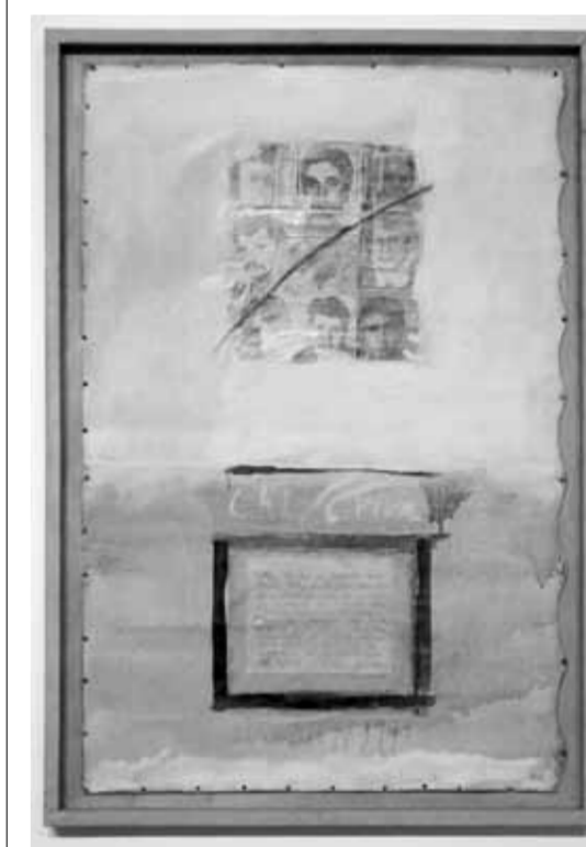
Cal - Cal viva, 1978, Colección MAC, U. de Chile. Roser Bru, pintora y grabadora.