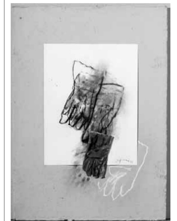
De la serie “Lota”, 2002. José Balmes , pintor. Premio Nacional de Arte .