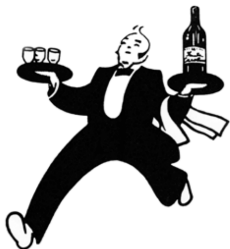
Ekfrasis para Díptico Nacional. Gonzalo Díaz, U. de Chile. Premio Nacional de Arte.

paño sacabrillo ondea doblado a su codo, subrayando con su flameante ingravidez la velocidad del gesto e instituyendo la bandera de un gremio a media asta.