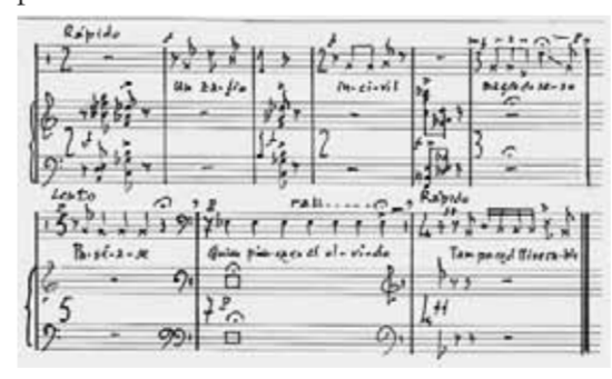
Ejemplo: recitativo (síntesis) Apuntes para un retrato general , sobre textos de Omar Lara, para voz y piano (estrenada en La Habana, en 1989). Fernando García, compositor y musicólogo, U. de Chile. Premio Nacional de Música.

MOVIMIENTOS SOCIALES. Una ética perteneciente al ser social. "No se detienen los procesos sociales, ni con el crimen, ni con la fuerza. La historia es nuestra y la hacen los pueblos." Fragmento último discurso de Salvador Allende, 1973. La desesperanza se ha transformado en el signo de los tiempos. El orden establecido es lo suficientemente violento como para aquietar la acción; el devenir. Millones de ciudadanos que, en una imagen nostálgica, caminaban por las calles, la voz de un pueblo sobre alamedas, que hoy se ha trasladado al automatismo de la vereda de cemento. Una duda irreverente que pone inestabilidad sobre el sentido, sobre el cómo y el para qué . Los movimientos sociales surgen de los movimientos individuales, una revolución que permita abrir el diálogo, provocar al movimiento. Seducir al roce discursivo, seducir al choque de argumentos, seducir al dolor del pasado, seducir los deseos del presente, seducir a otro a pensar sobre el seducir a otros. Quizá, las calles quedarán en una imagen petrificada como el lugar de habla de un pueblo, de un país; pero los movimientos, los procesos sociales, no se detienen. Las utopías no divagan sobre lo irreal, sino sobre la necesidad. La materia no desaparece, se transforma... el hombre y la mujer, deben ser y hacer historia. Héctor Freire, director y actor de teatro.