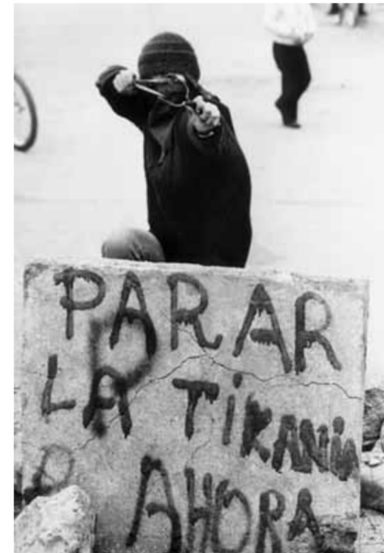
Esta tiranía que no tiene superlativo (“Esta crueldad que no tiene superlativo”, G. Mistral), Kena Lorenzini , fotógrafa .