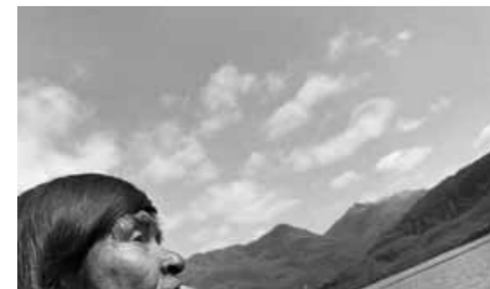
Puerto Edén, de la serie “Nómades del Mar”, 2002. Paz Errázuriz , fotógrafa .