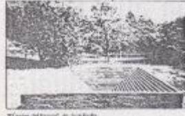
"El campo del hombre", de José María

El libro de cartografía es la muestra de la diversidad y el respeto por la diversidad cultural. El libro es el resultado de un trabajo conjunto de investigadores de la Universidad de Bogotá y de la Universidad de los Andes. El libro es el resultado de un trabajo conjunto de investigadores de la Universidad de Bogotá y de la Universidad de los Andes.