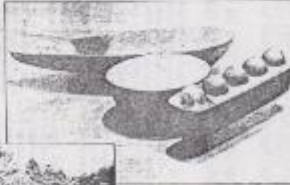
"Mapa", de Tomás Rivera